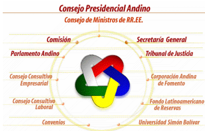
GRÁFICO 1 Sistema Andino de Integración

La Comunidad Andina está integrada por Bolivia, Colombia, Ecuador, Perú y Venezuela, y por los órganos e instituciones del Sistema Andino de Integración.